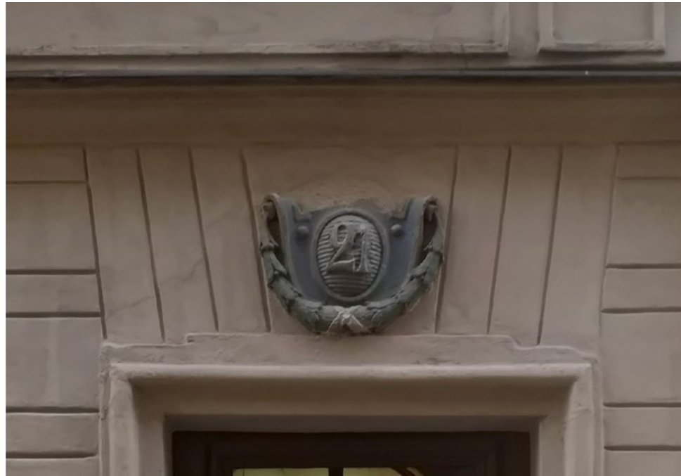
Eget fotografi november 2021