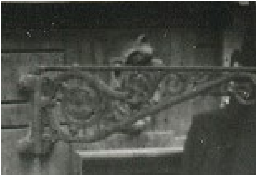
Förstoring av fotografi från 1907. Fotografi visar att kartuschen haft en centrerad volut med bladornament ovan.