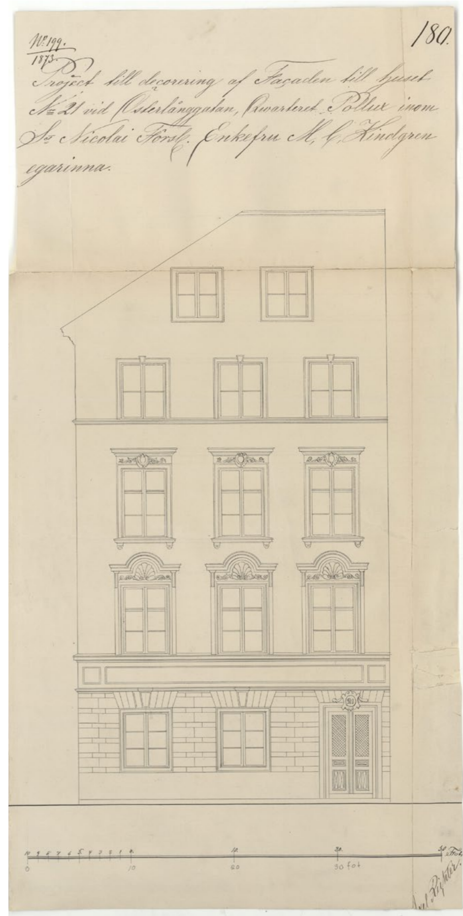
Fasadritning av Axel Richter 1873.

Fasadens nya utformning signeras på ritning av Axel Richter. Denna bör ha varit stuckatör och inte arkitekt då information om honom saknas i register. Troligtvis beroende av att stuckatörer inte ännu hade ett eget reglerat yrkesskrå till skillnad från arkitekterna. Det är oavsett Richters verk som än idag pryder fasaden mot Österlånggatan.